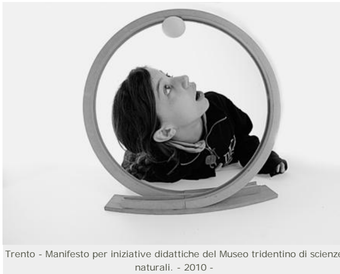
Trento - Manifesto per iniziative didattiche del Museo tridentino di scienze naturali. - 2010 -